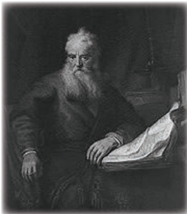
Rembrandt – portret sv. Pavla

Sveti Pavao je svetac rimokatoličke crkve, misionar u Maloj Aziji, Grčkoj, Rimu, teolog, napisao više poslanica Novoga Zavjeta, mučenik. Rođen je između 5. i 10. godine poslije Krista. Papa Benedikt XVI. prošle je godine u bazilici sv. Pavla u Rimu najavio Godinu svetoga Pavla koja će trajati od 29. lipnja 2008. do 29. lipnja 2009. godine