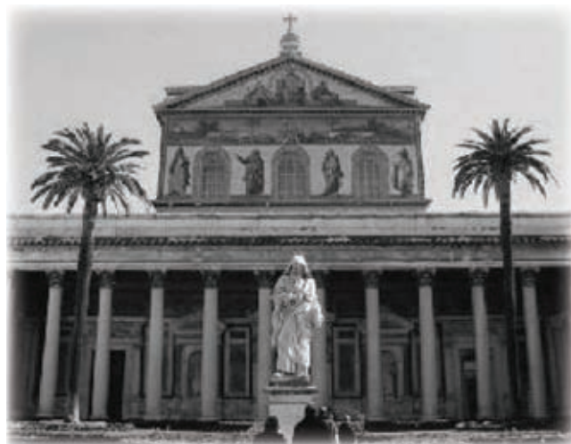
Bazilika sv. Pavla

Spomenimo i to da su u Hercegovini četiri župe posvećene sv. Petru i Pavlu: Mostar, Kočerin, Gorica-Struge i Rotimlja, a da je više filijalnih kapelica posvećenih sv. Petru i Pavlu: župa Gradina – kapelica sv. Petra i Pavla u Biletić Polju; župa Gorica – kaplica sv. Petra i Pavla u Sovićima; župa Grabovica – kapelica sv. Petra i Pavla na Zidinama, župa Grljevići – filijalna crkva sv. Petra i Pavla u borajni i župa Klobuk – kapelica sv. Petra i Pavla u Poljanama.