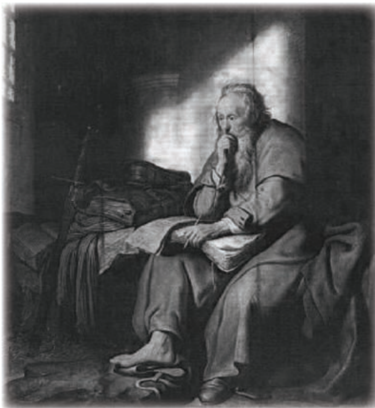
Sveti Pavao u tamnici

kako su se pogubljivali punopravni građani Rima (a ne razapinjanjem).